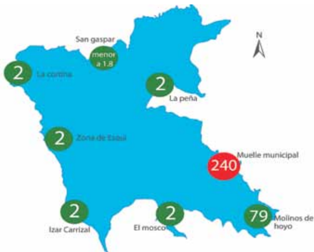
ANÁLISIS DE AGUA DE CONTACTO 17 DE ABRIL DE 2015

A continuación presentamos el nivel de precipitación pluvial de Valle de Bravo, como se encuentra el nivel de la presa de Valle de Bravo y su calidad de agua hasta el mes de abril.